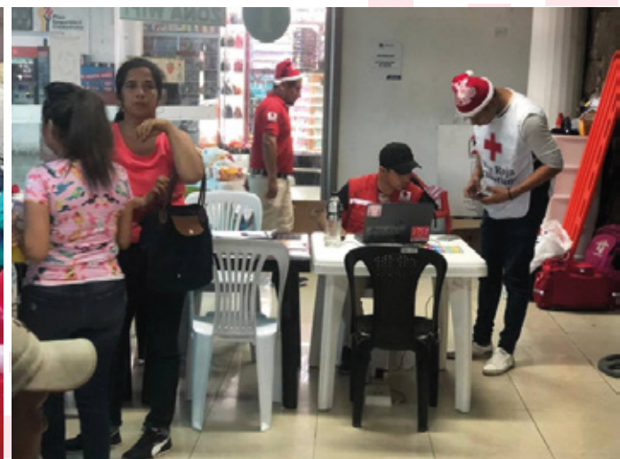
Foto: Punto de atención para migrantes en el Terminal de Santo Domingo.

En las fronteras, en el Centro Binacional de Atención Fronteriza, en Sucumbíos y en el Terminal Terrestre de Santo Domingo nuestros voluntarios realizaron programas navideños para personas migrantes.