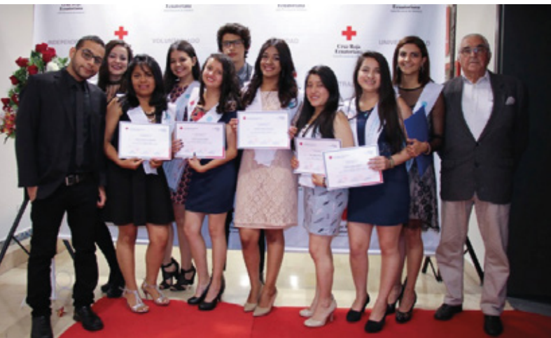
Imbabura - Asistencia en Laboratorio Clínico