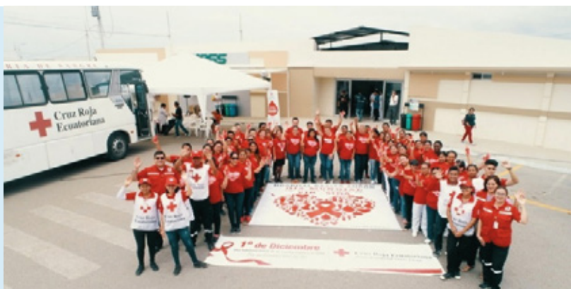
Foto: Vigilia simbólica en memoria de las personas fallecidas por VIH.

Durante 32 años, Cruz Roja Ecuatoriana (CRE) ha desarrollado actividades enfocadas a la respuesta frente a la epidemia del VIH. Entre ellas, capacitaciones, Salas de Asesoría en Prueba Voluntaria, Grupos de Apoyo Mutuo (GAM) que están dirigidos a personas con VIH. Estos servicios no tienen ningún costo y la información se maneja con absoluta confidencialidad.