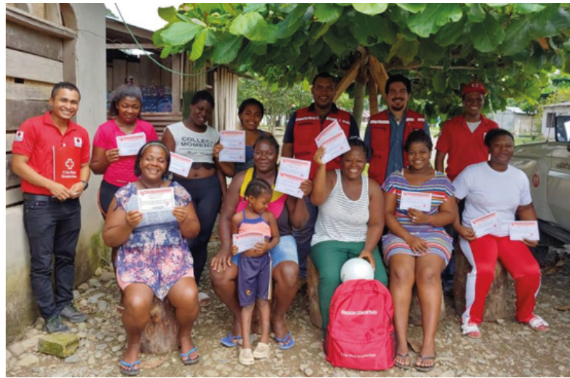
Esmeraldas – Primeros Auxilios con apoyo del CICR