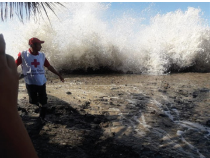
Esmeraldas – Afectación por oleajes