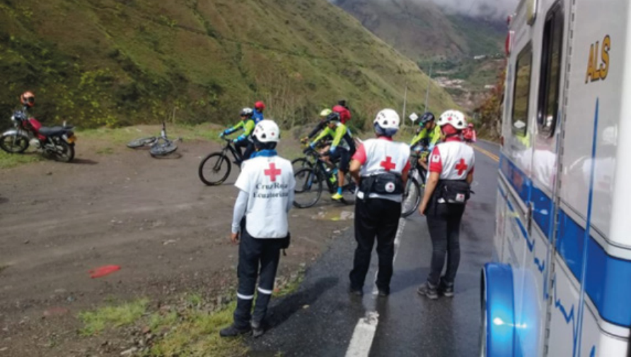
Imbabura – Apoyo a Colombia en el MTB Challenger 2018