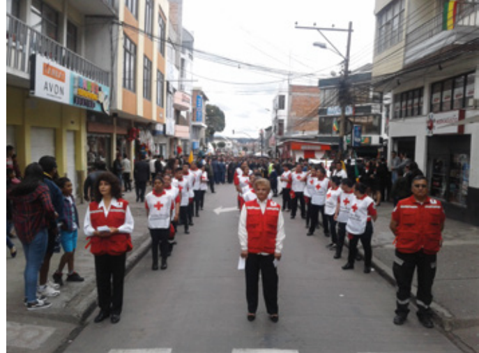
Carchi - 138 años de provincialización