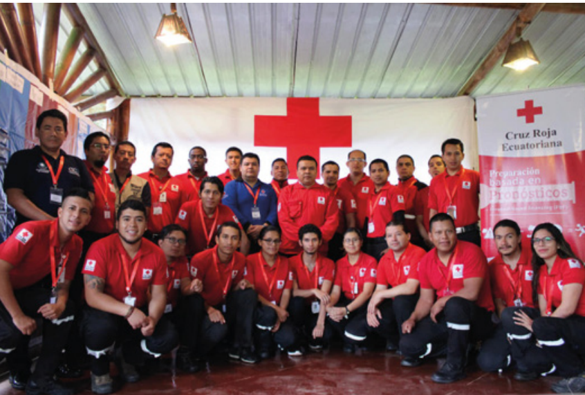
Santo Domingo – Taller de Evaluación de Daños y Análisis de Necesidades