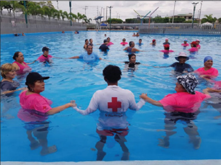
Guayas – Cuidado en el Balneario Artificial de Sauces VI