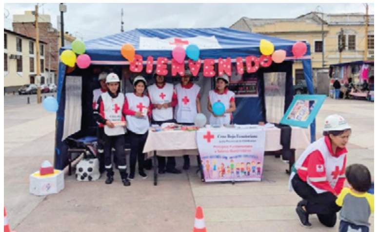
Foto: A través de juegos se enseñaron los Derechos Humanos.

En conmemoración del Día Internacional de los Derechos Humanos, 10 de Diciembre, nuestros voluntarios en Pichincha y Chimborazo organizaron varias actividades. En las dos provincias se colocaron stands en la Feria de Derechos Humanos (Pichincha) y en la Feria de las Organizaciones Sociales y los Derechos Humanos (Chimborazo). Nuestros voluntarios compartieron con la comunidad y la sensibilizaron en la temática.