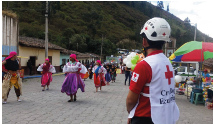
Imbabura - Fiestas de parroquialización de San Francisco de Sigsipamba