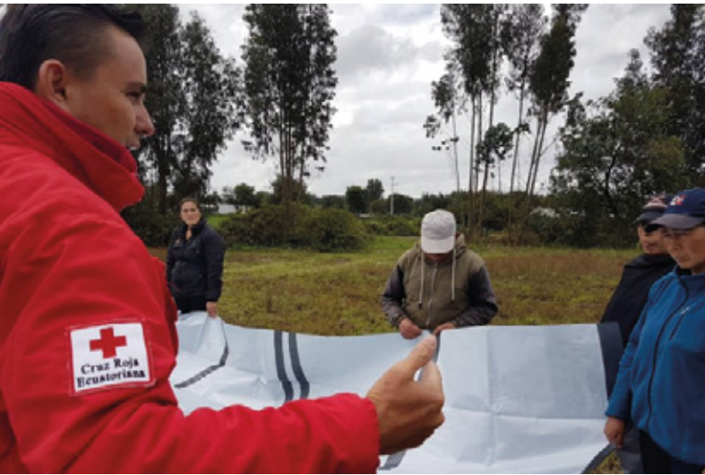
Cotopaxi - Armado de refugios para ganado y cultivos