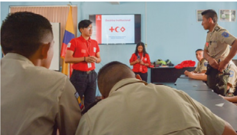
Foto: En Ambato se visitó la Escuela de Formación de la Policía Nacional.

El Derecho Internacional Humanitario se promociona