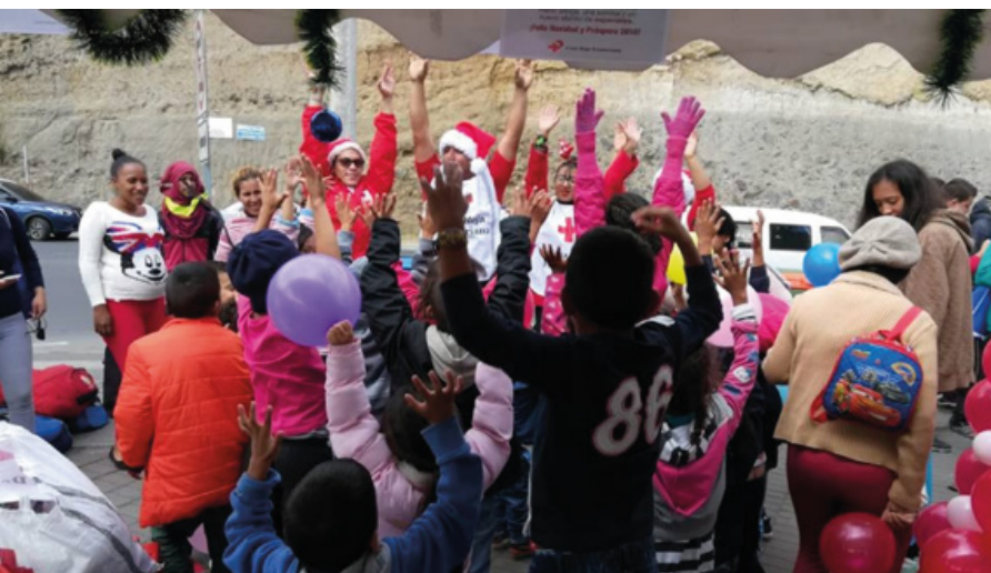
Foto: En Rumichaca se organizaron juegos para los más pequeños.