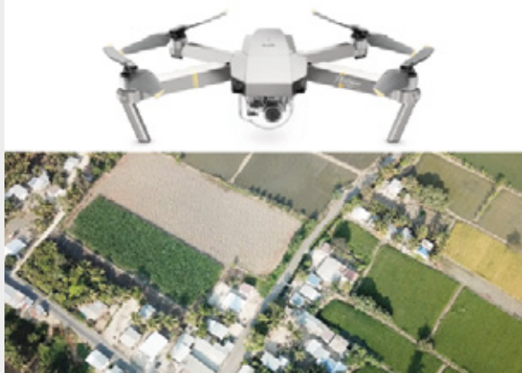
Foto tomada con el nuevo dron de Cruz Roja Ecuatoriana.

Nuestro programa de Gestión de Riesgos, a través del proyecto Preparación basada en Pronósticos, realizó la adquisición de un Drone que tiene la capacidad de captar información en tiempo real. El uso del Drone ayudará a los actores en terreno a comprender la magnitud de la situación en caso de que se produjera un evento adverso, como un terremoto, inundación entre otros.