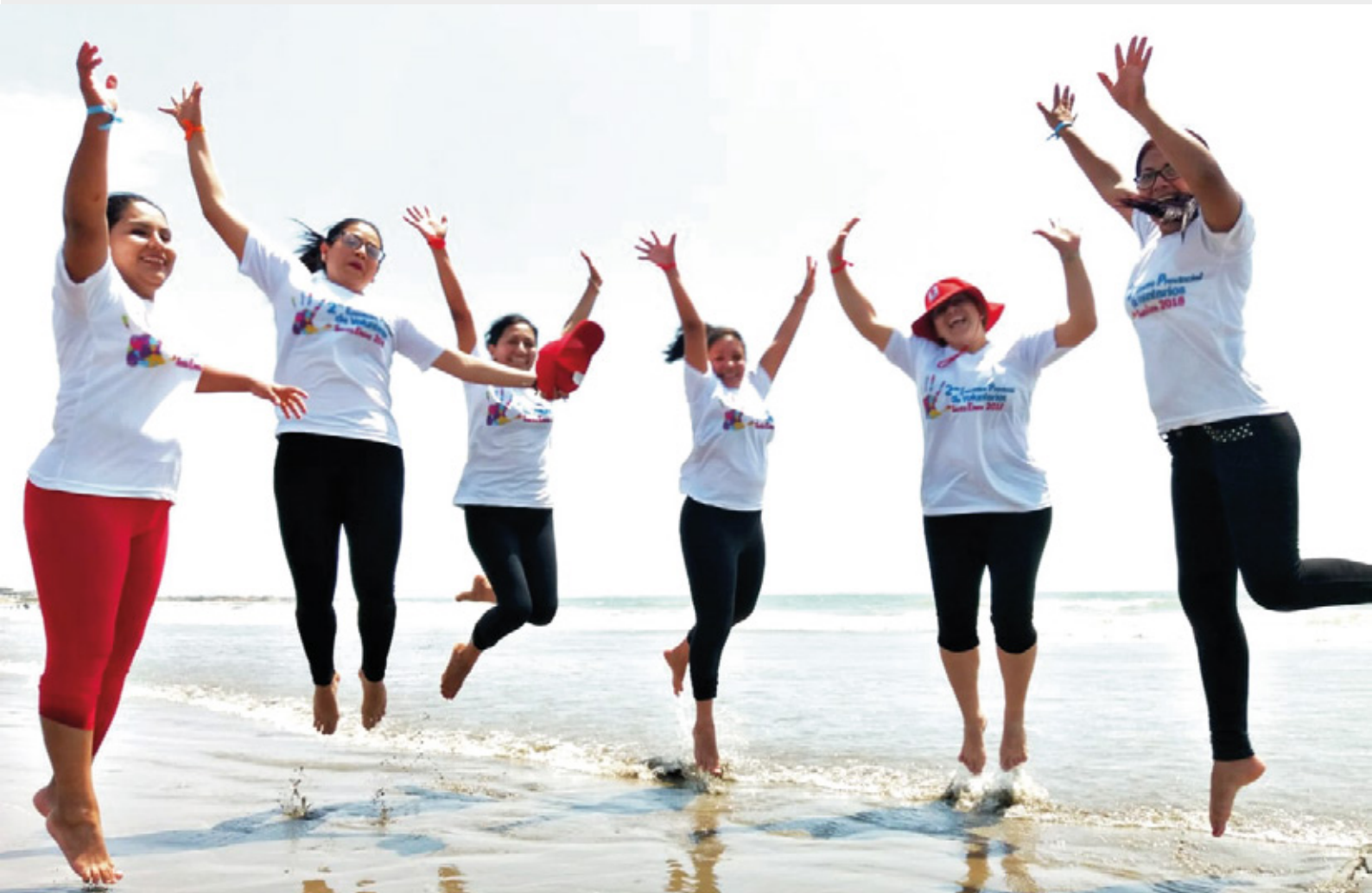
Foto: Para festejar el Día Internacional de los Voluntarios, Santa Elena organizó un encuentro provincial.