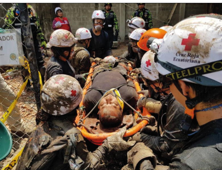
Guayas – Rescate en estructuras colapsadas